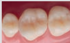
Imágenes clínicas por cortesía del Dr. Osama Shaalan